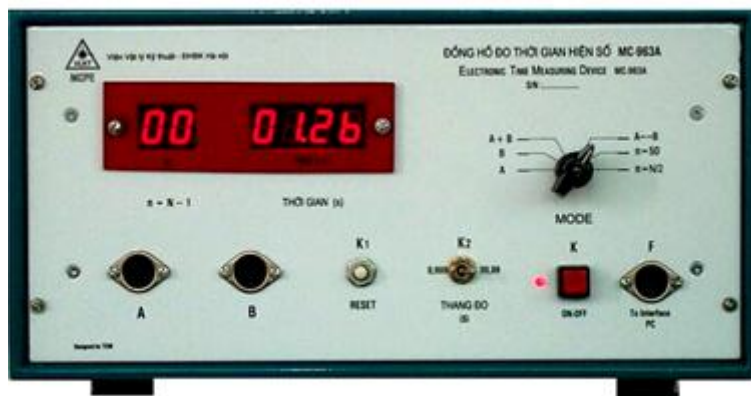
Hình 2. Đồng hồ đo thời gian hiện số

Trên đây là đồng hồ đo của chúng ta (trông rất hiện đại), chú ý một số phòng đồng hồ có thể hơi khác nhưng nhìn chung thì cũng tương tự thế này \rightarrow các bạn chú ý thông số ban đầu của đồng hồ này (thường là đã được thiết lập sẵn nên chỉ cần bấm mỗi khóa K và kết nối là xong, tuy nhiên có một số trường hợp những nhóm làm trước chơi tuyệt chiêu qua